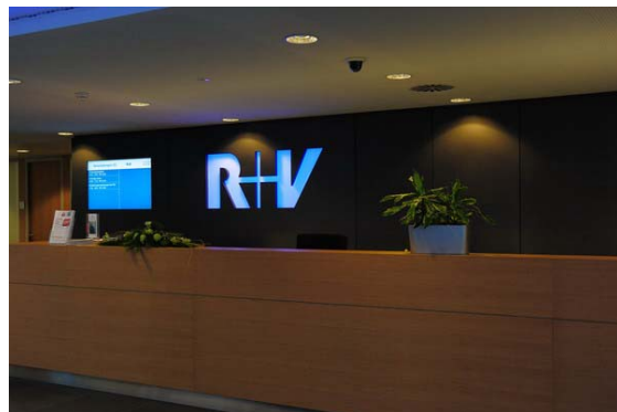
Die gebäudehohe Eingangshalle mit Foyer (Foto links und rechts oben).